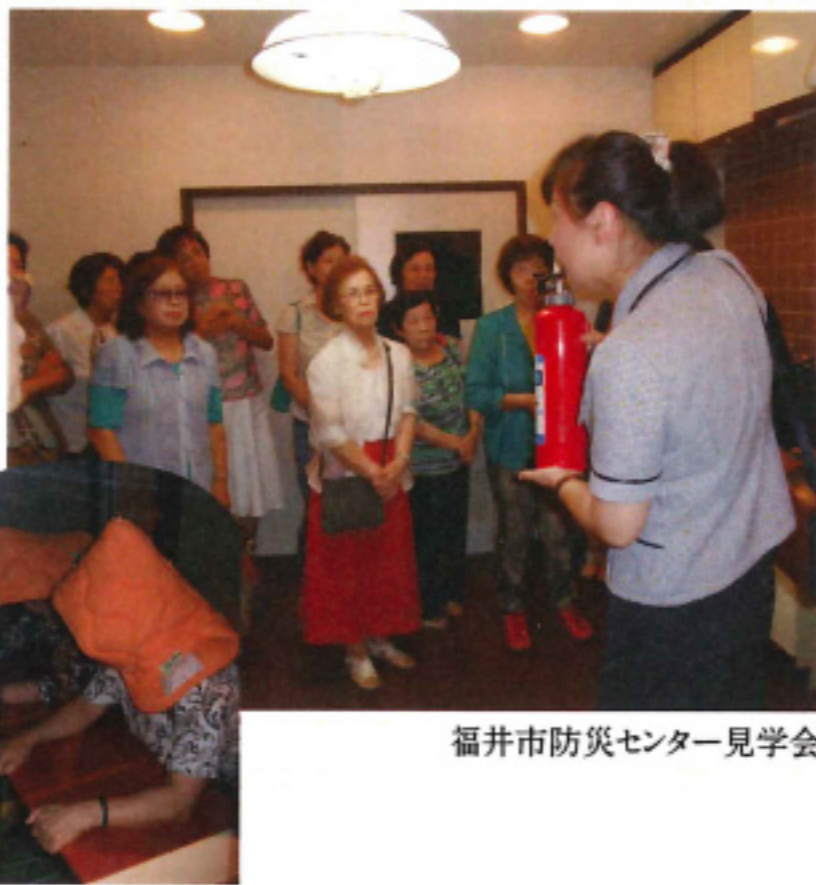
福井市防災センター見学会