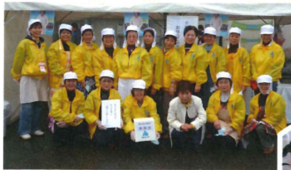
わんぱく駅伝 トン汁鍋提供