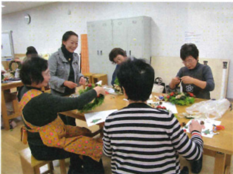
リース作り講習会