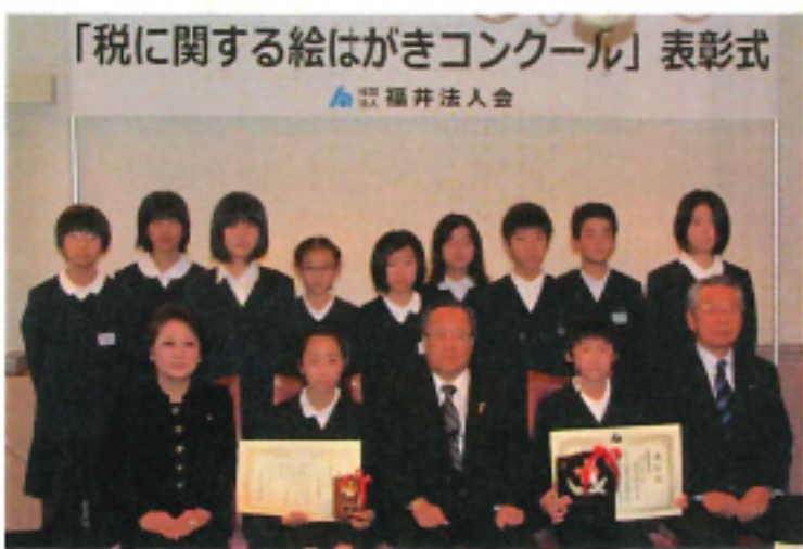
「税に関する絵はがきコンクール」表彰式 福井法人会