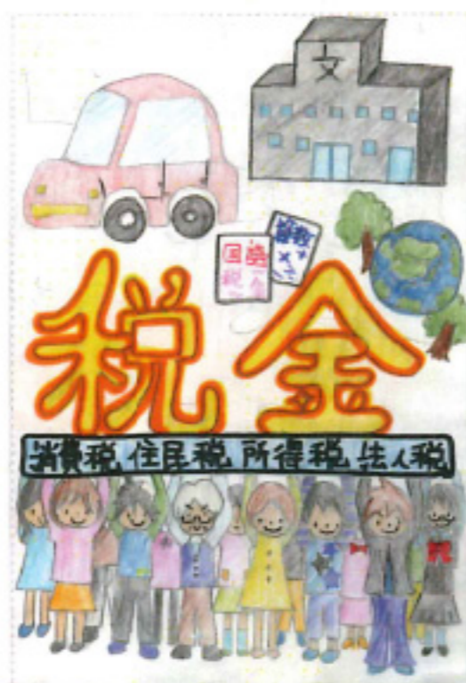
福井新聞社長賞 勝山 彩音