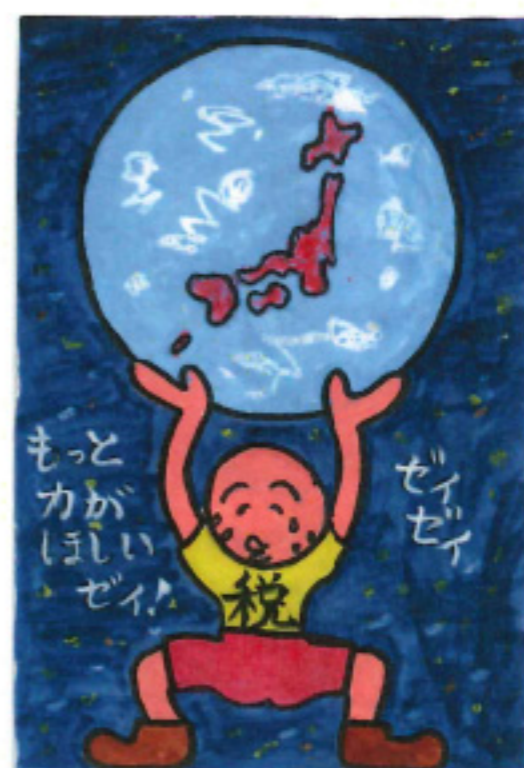
永平寺町長賞 田中 玲音