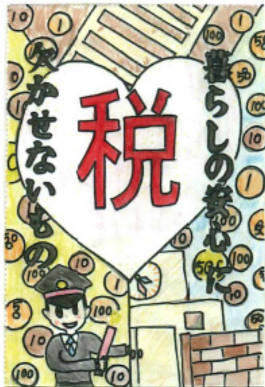
福井税務署長賞 市岡 真奈