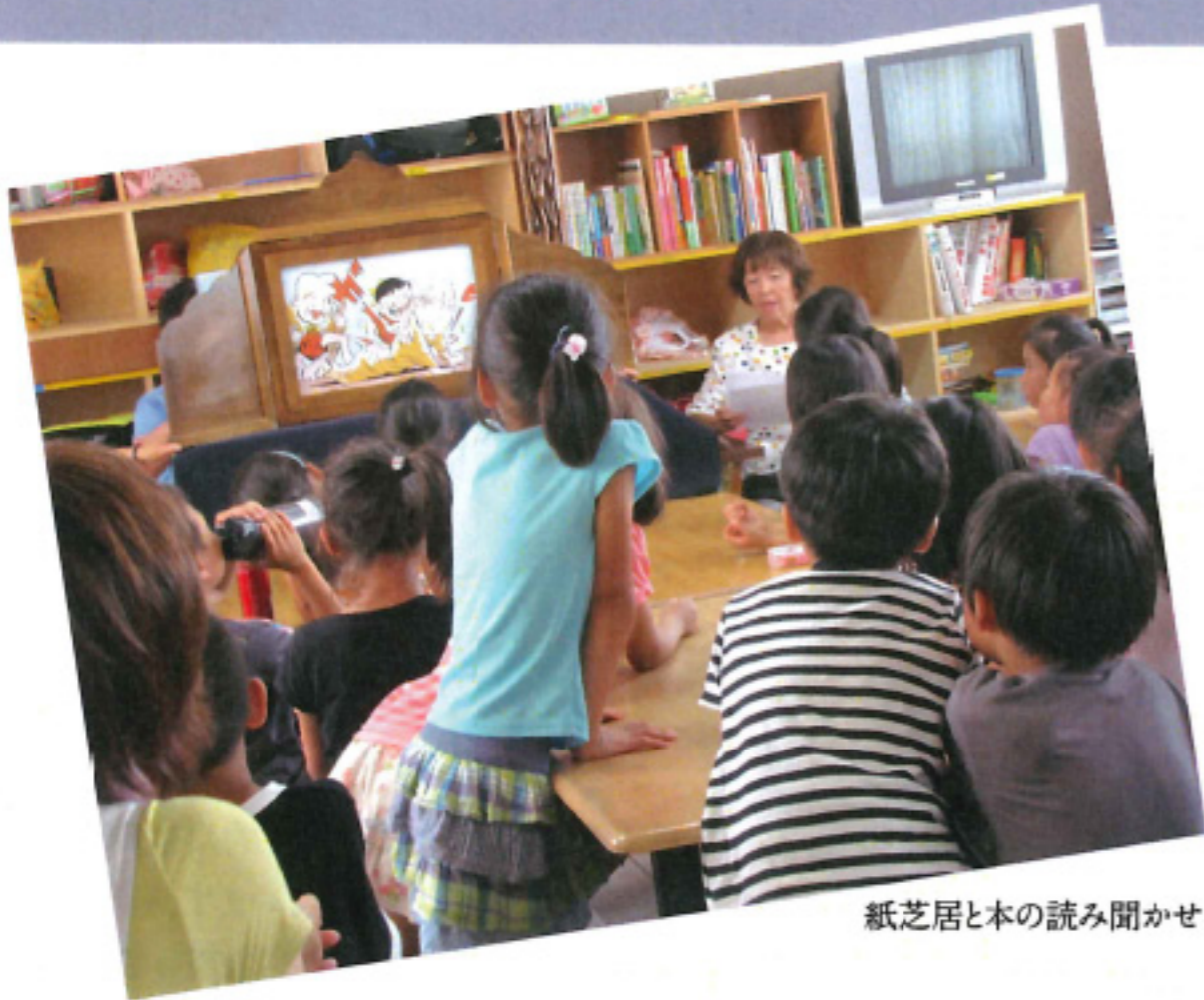
紙芝居と本の読み聞かせ