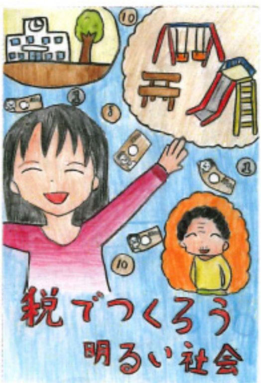
福井FM放送社長賞 菅波 沙織