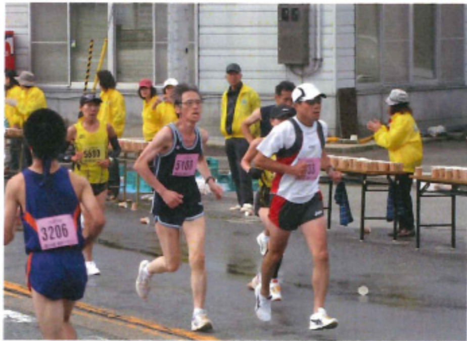
福井マラソン大会 給水提供

女性特有のきめ細やかさを打ち出した社会貢献活動を念頭に、色々なことに取り組みました。 とくに今年は租税教育活動として新しい紙芝居を作成し、多くの子供たちに読み聞かせることが出来ました。また、恒例の活動では、多くの会員の方々の協力をいただいたこと感謝しています。