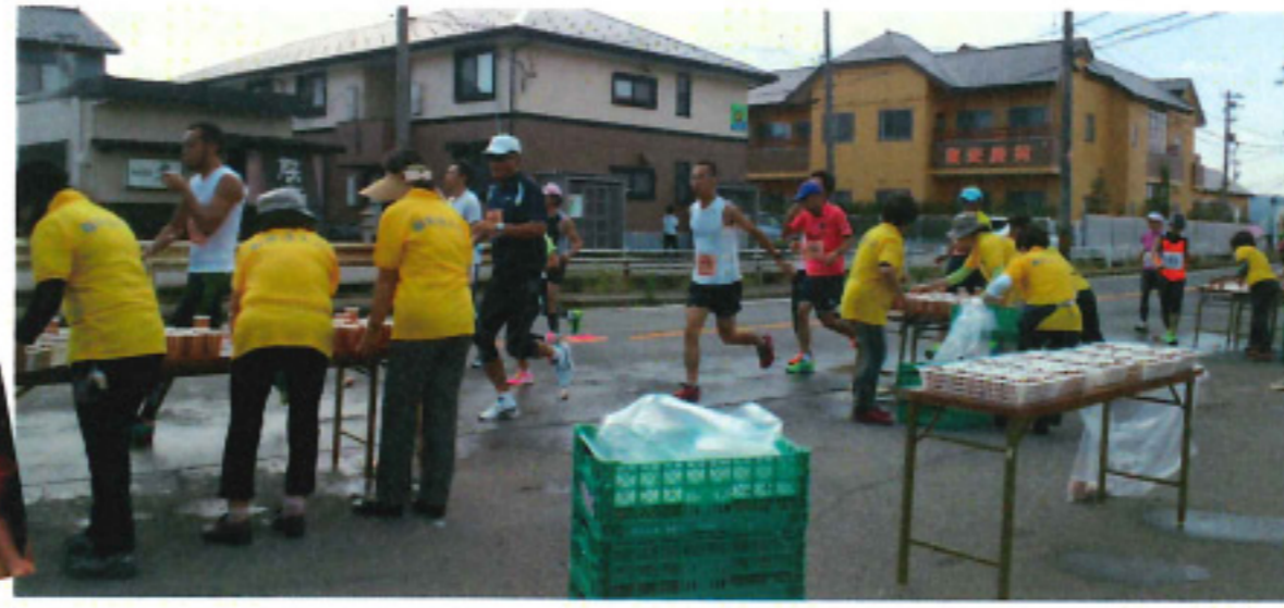
福井マラソン大会 給水提供

次世代を担う子供たちに、税の重要性を認識させるための「税に関する絵はがきコンクール」の実施。また、紙芝居を中心とした租税教育活動も積極的に取り組んだ1年。地域社会貢献活動では、福井マラソン大会時の給水ボランティア活動、「わんぱく駅伝・中学女子駅伝」時のトン汁鍋提供にも取り組んでいます。