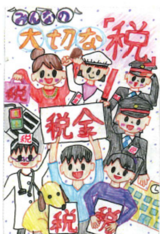
福井新聞社長賞 奥島 亜実