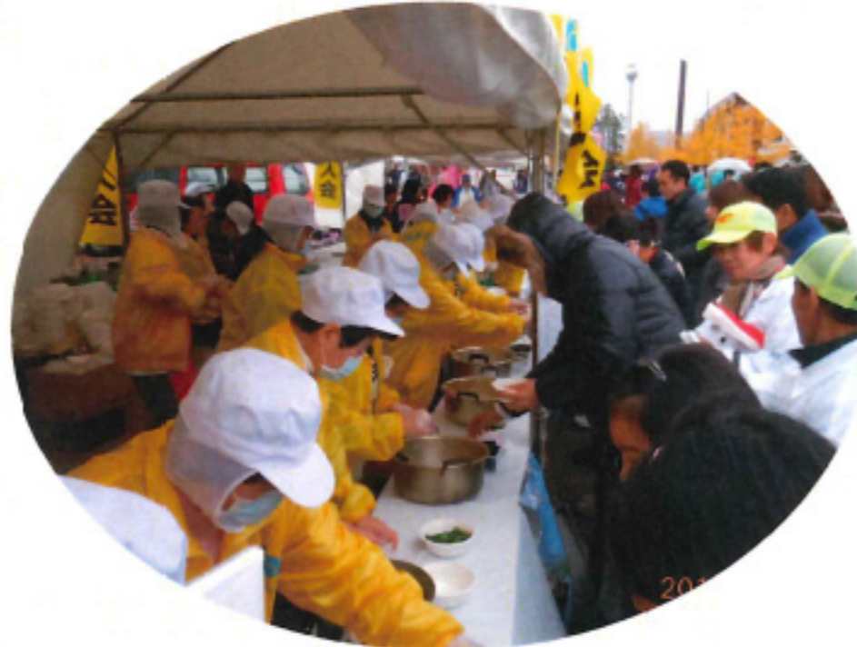
わんぱく駅伝 トン汁鍋提供

次世代を担う子供たちに、税の重要性を認識させるための「税に関する絵はがきコンクール」の実施。また、紙芝居を中心とした租税教育活動も積極的に取り組んだ1年。地域社会貢献活動では、福井マラソン大会時の給水ボランティア活動、「わんぱく駅伝・中学女子駅伝」時のトン汁鍋提供にも取り組んでいます。