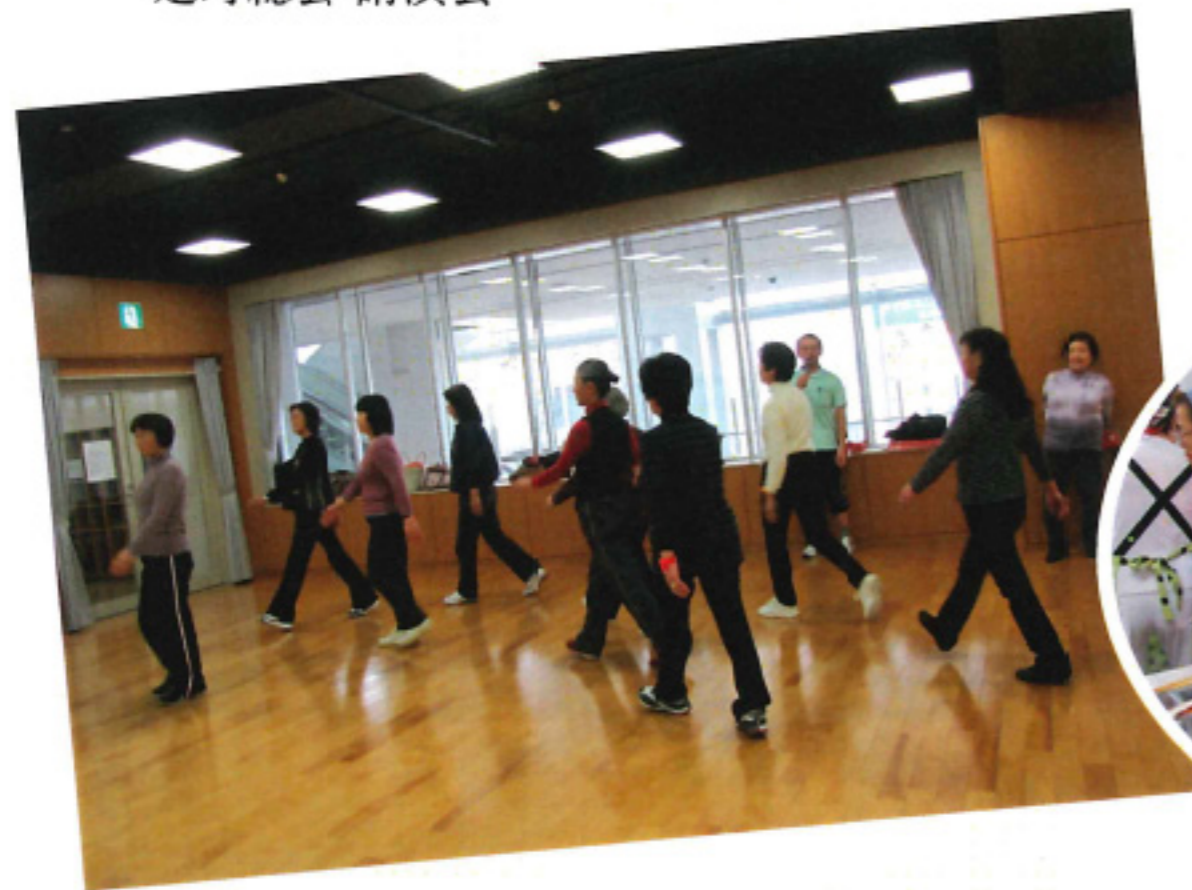
アンチエイジング講習会