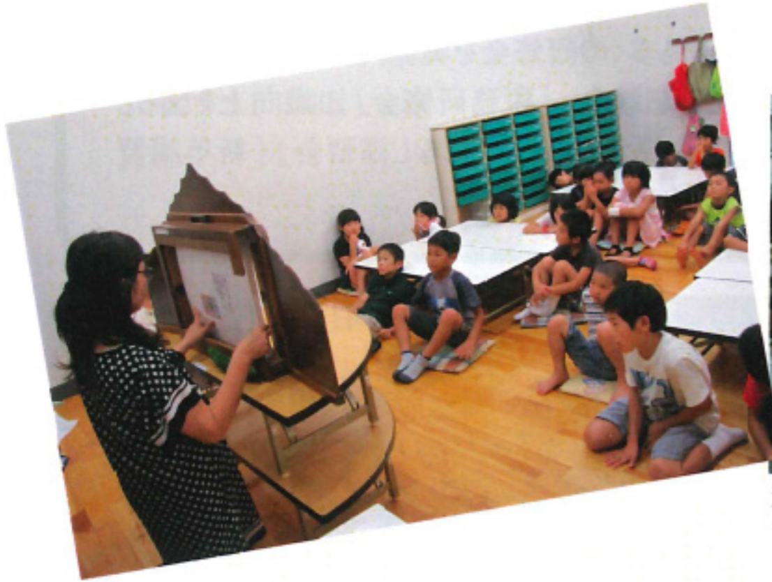
紙芝居と本の読み聞かせ