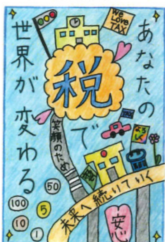
福井市租推協会賞 出口 万菜