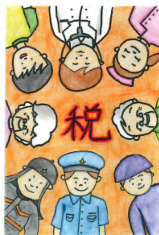
福井FM放送社長賞 堂前 美花