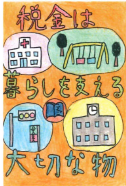
福井市租税教育推進協議会長賞 立山 瑞貴