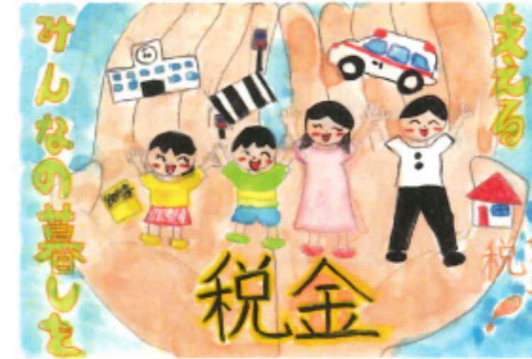
福井FM放送社長賞 高島 玲奈