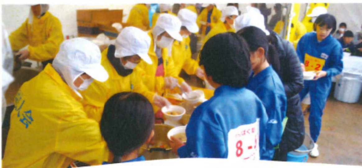
わんぱく駅伝 トン汁鍋提供

地域に密着した社会貢献活動として、わんぱく駅伝でのトン汁提供、福井マラソンでの給水ボランティア活動、税に関する絵はがきコンクールの実施、地域の子供たちに税の紙芝居の読み聞かせと多くの事業を実施しました。