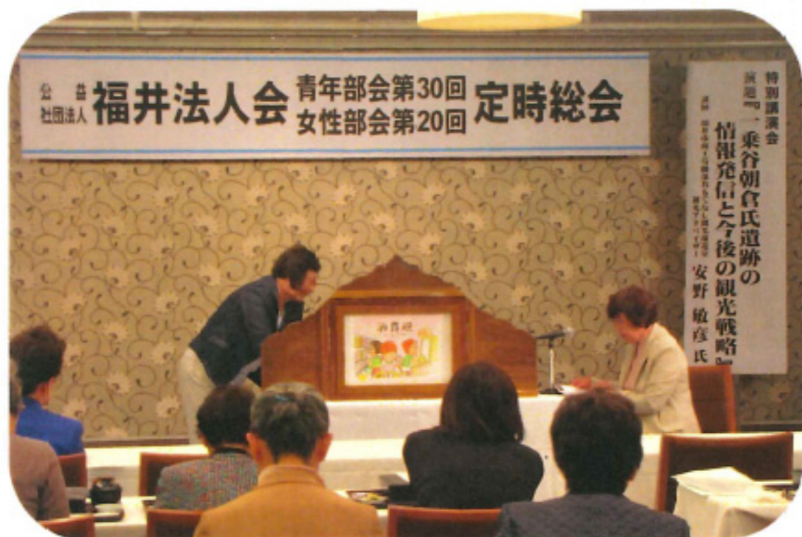
会員に向けて新しい紙芝居の披露