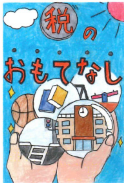
福井新聞社長賞 清水 崇志