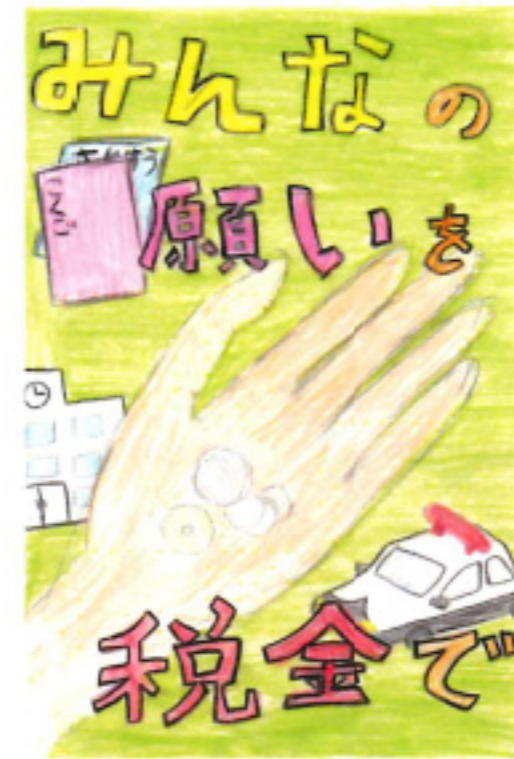
永平寺町長賞 川端 詩乃