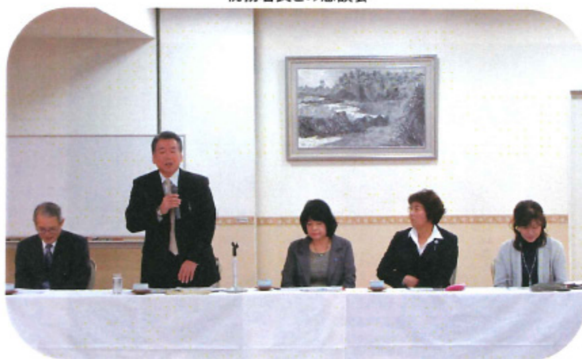
税務署長との懇談会

活動を多くの方に広めるために年1回のレポートの作成と年2回発行しているWORTH内女性部会ページの作成をおこないました。