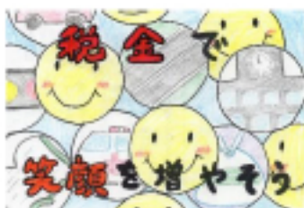
福井テレビ社長賞 日置 好乃