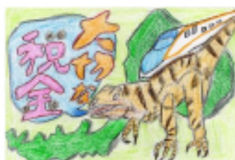
福井放送社長賞 朝倉 藍加