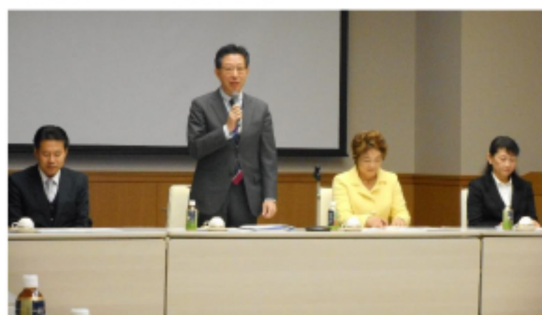
税務署長との懇談会 (H29.11.27)