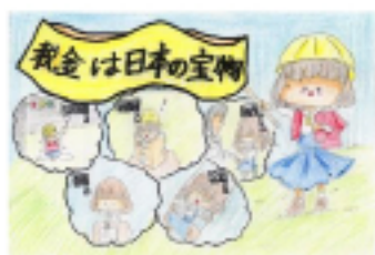
永平寺町長賞 山口 夕稀乃