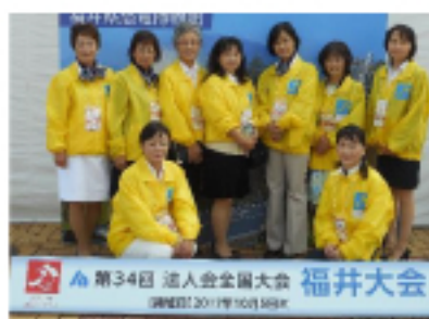
法人会全国大会福井大会 (H29.10.5)