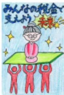
福井市租税教育 推進協議会長賞 長光 心優