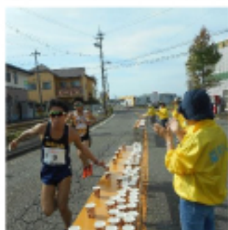
給水ボランティア (H29.10.1)