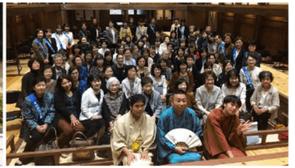
県女連研修会 (主管：小浜法人会) (R1.10.10)

第10回優秀作品展示 令和2年2月5日 福井春山合同庁舎 福井市役所 永平寺町立図書館 福井銀行(清水町支店) 福井信用金庫(二の宮支店) 北陸銀行(松本支店) 福井南郵便局 ショッピングセンターイベル ラブリーパーターナーエルパ