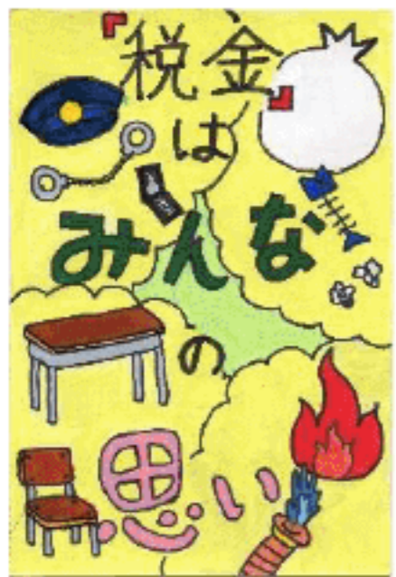
福井エフエム放送 社長賞 竹下 珈花