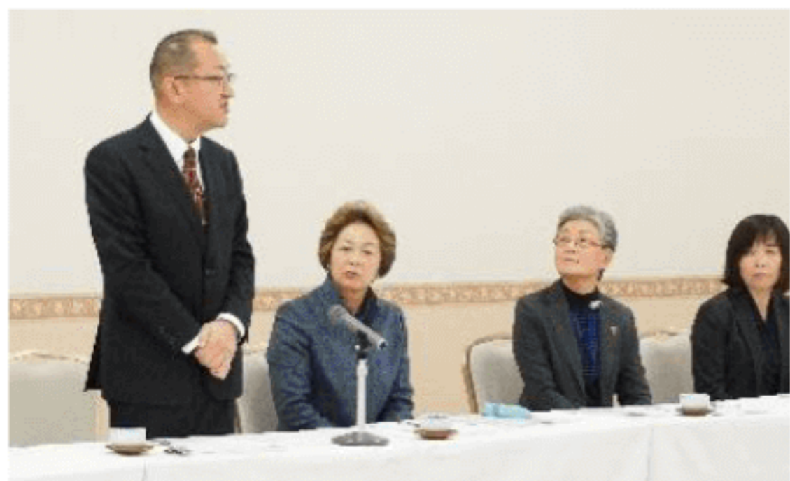
税務署長との 懇談会 (R1.12.3)