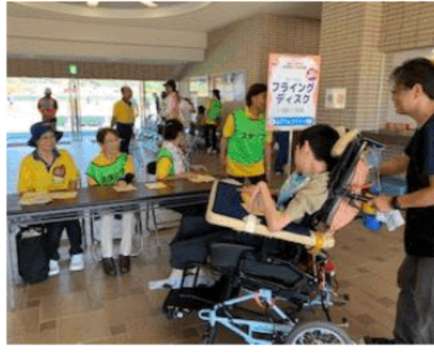
福井しあわせ障スポ☆フェスタ ボランティア活動 (R1.9.8)