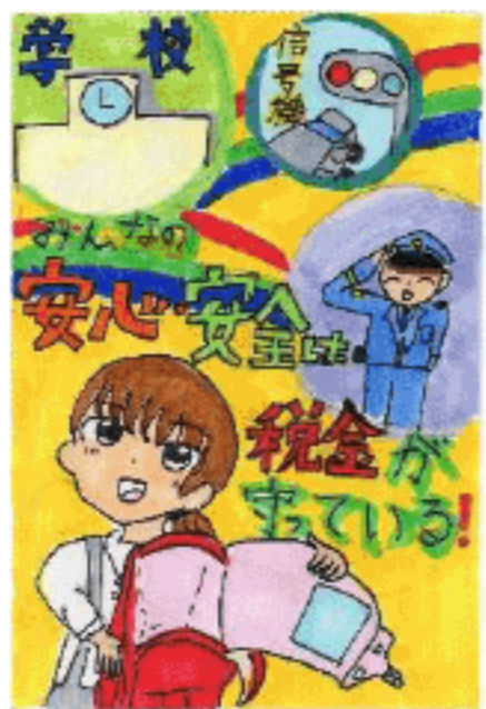
福井放送社長賞 上栗 千奈