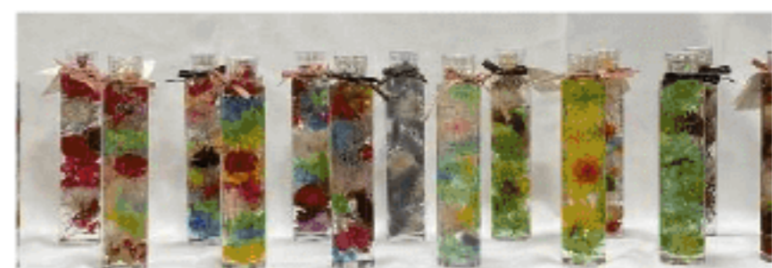
ハーバリウム 講習会 (R1.12.3)