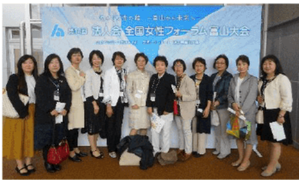
全国女性フォーラム (富山大会) (H31.4.25)