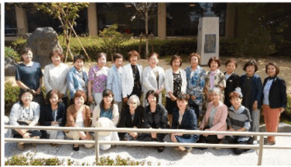
初秋の観能会 (金沢法人会) (R1.9.18)